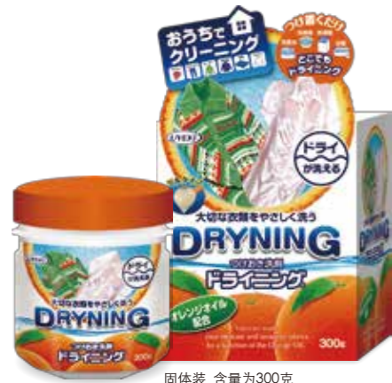
固体装 含量为300克 附送量勺与用量指南