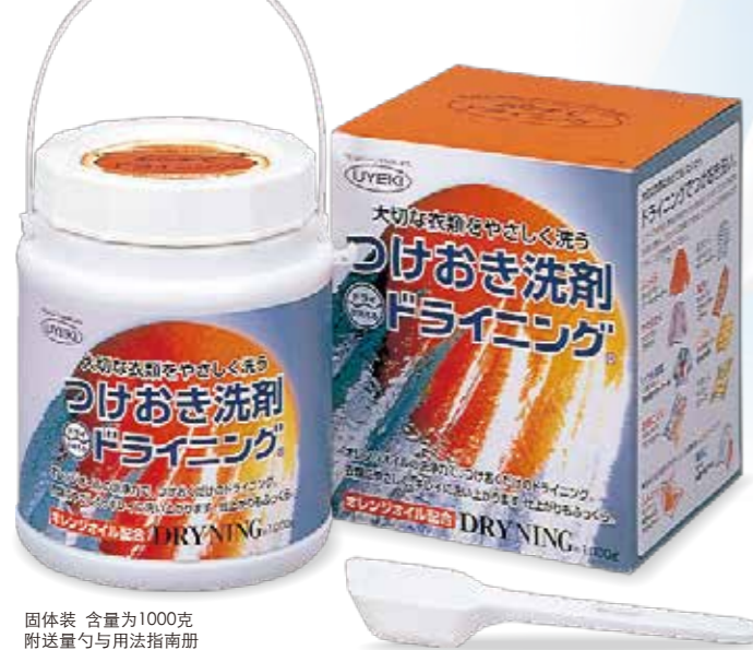
固体装 含量为1000克 附送量勺与用法指南册