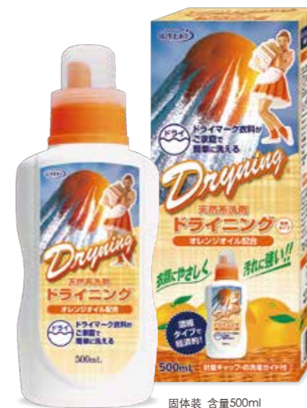
固体装 含量500ml 附送量勺与用法指南册