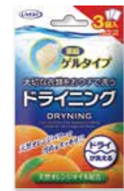
一次性使用装 含量15克x3包